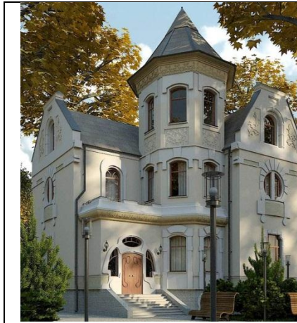
Рис. 5. «Замок» сучасного кшатрія

Такого замовника цікавлять інші цінності і якості споруди: вірне розміщення на ділянці, максимально нейтралізуюче гепатогенні зони, комфортне і безпечне рішення планування, яке є прихованим від зовнішніх поглядів, але повністю відповідає вимогам такого незвичного замовника, екологічністю і природністю матеріалів, скоріше за все повною відсутністю зайвих деталей і декору, але присутністю різних знаків і форм, важливих для енерго-інформаційної гармонізації простору і середовища життєдіяльності