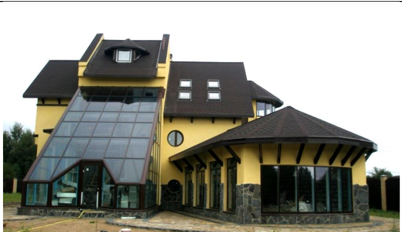
Рис. 6. Замок ХХІ століття: будинок-фортеця