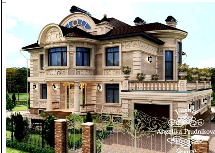
Рис. 3. Багатство і перенасичення форм, кольорів, деталей – краща ілюстрація відображення прагнень життя «Торговців» (вайшів)