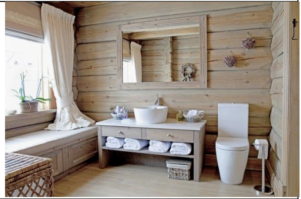
Рис. 8. Екологічно, корисно, зручно, безпечно

Висновки. Спираючись на трирівневу структуру побудови Всесвіту та на трирівневу класифікацію потреб людей, виявляються основні принципи існування як окремих людей, так і певних груп людей, а також пропонується класифікація користувачів архітектурно-дизайнерської продукції згідно принципів їх існування. Пропонується класифікувати людей за належністю їх до духовних каст згідно притаманних їм підходів до мети і до принципів досягнення ними успіхів: «Фізичні трударі» (шудри), «Торговці та посередники» (вайші), «Службовці» (кшатрії), «Працівники духовної сфери» (браміні). Не лише фізична належність замовника до певного соціально-економічного класу, але, ще важливіше, належність до певної духовної каст є визначною для вибору принципів формотворення архітектурних і дизайнерських об'єктів.