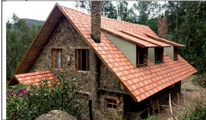
Рис. 7. Будинок і природа – спосіб єднання, а не протистояння