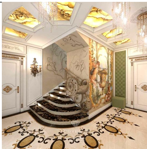
Рис.4. Інтер'єр будинку людей, головний принцип існування яких є накопичення та демонстрація матеріальних благ

Для проявів принципів сучасних «кшатріїв» («службовців») в формотворенні їх будівель будуть характерні, скоріше за все, добротність матеріалів і конструкції споруди, складність плану і об'ємно-просторового рішення, чіткість форм і ліній, прямі кути, можливо, своєю замкнутістю мати подібність до замку, фортеці, або з повністю відсутнім декором, або декором, виконаним шляхетно, дійсно якісно, зі смаком, який буде вказувати на ранг і могутність володаря, підкреслювати статус престижністю творіння архітекторів і будівельників Рис. 5, 6.