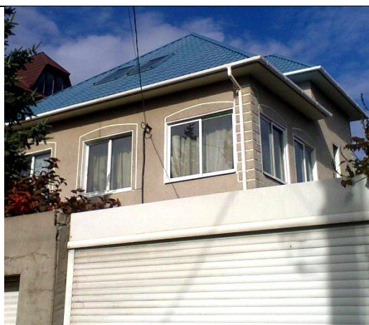
Рис.2. «Народний стиль» «народної архітектури». Фотофіксація автора, 12.10.17