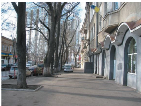
Рис. 2. Ул. Л. Толстого. Достаточно много места для перспективного расширения проезжей части, просторный тротуар, газон