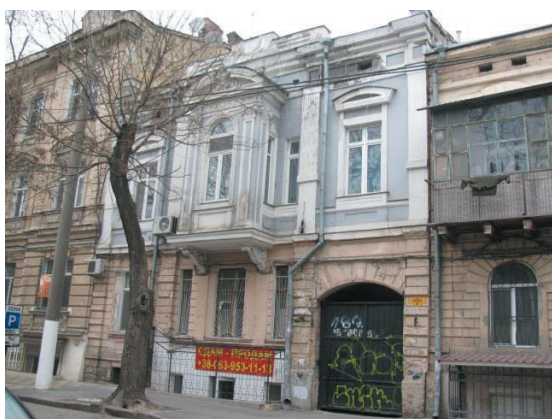
Рис. 8. Ул. Кузнечная, 27