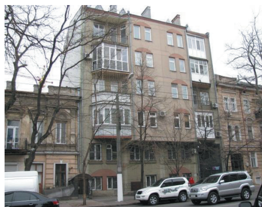
Рис. 11. Ул. Успенская, 115. Непропорциональное решение высот этажей, новый фасад конфликтует с существующей застройкой. Неудачная попытка решения арочного обрамления окон в стиле старой застройки