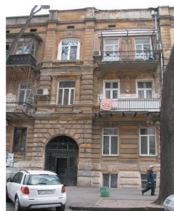
Рис. 9. Ул. Кузнечная, 25