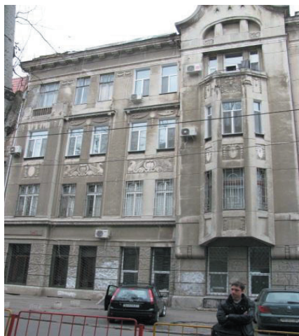
Рис. 6. Ул. Л. Толстого