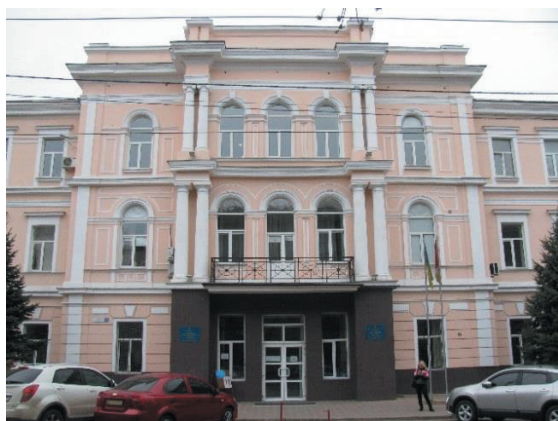
Рис. 4. Ул. Старопортофранковская