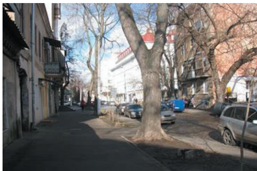
Рис.1. Ул. Кузнечная