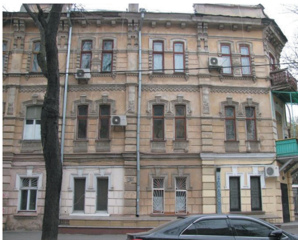
Рис. 7. Ул. Кузнечная, 35