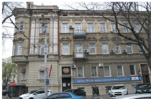
Рис. 5. Ул. Л. Толстого угол пер. Каретного