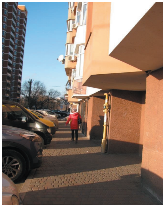
Рис.3. Ул. Дюковская. Очень мало места для тротуара и узкая проезжая часть. Перспективы реконструкции закрыты на многие десятилетия, хотя здание построено сравнительно недавно