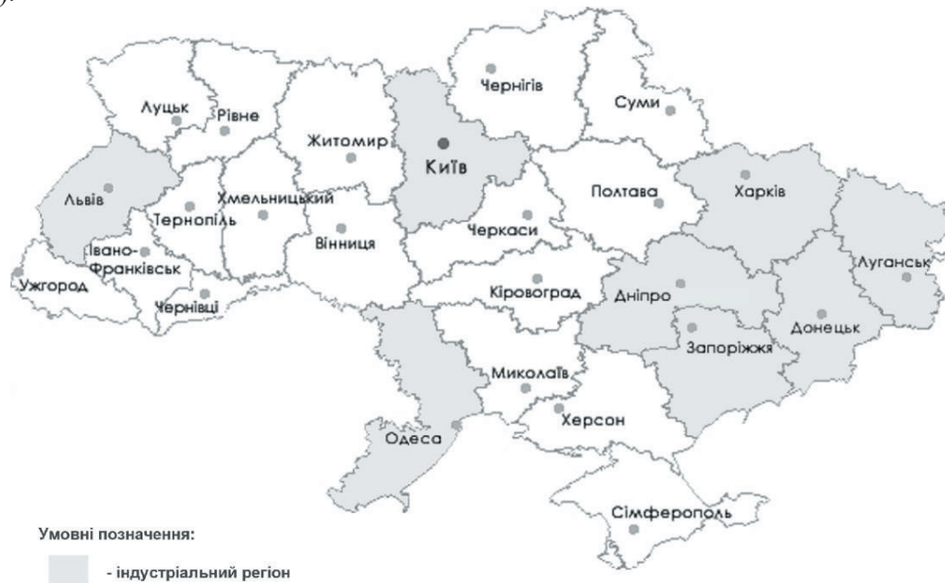
Рис. 2. Схема розташування індустріальних регіонів України

Таким чином, підсумовуючи попередні дослідження з врахуванням сучасного стану регіонів, їх особливостей та містобудівних показників, в Україні можуть бути виділені такі індустріальні регіони: Дніпропетровська, Донецька, Харківська, Запорізька області та м.Київ, а також наближені до них Луганська, Львівська, Одеська області та АР Крим. (рис.2).