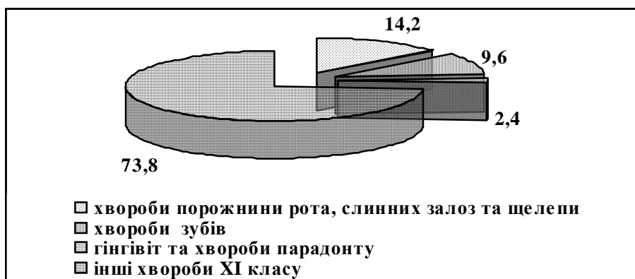
Рис. 2. Структура працевтрат військовослужбовців строкової служби в результаті хвороб органів травлення (з урахуванням хвороб порожнини рота) по нозологічним формам за 2009 - 2013 роки.

Загальні рівні працевтрат офіцерів в результаті хвороб органів травлення (з урахуванням хвороб порожнини рота) мали тенденцію до зменшення показників з 963,9 ‰ у 2009 році до 688,2 ‰ у 2013 році.