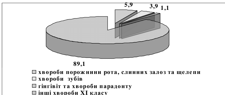
Рис. 4. Структура працевтрат військовослужбовців за контрактом в результаті хвороб органів травлення (з урахуванням хвороб порожнини рота) по нозологічним формам за 2009 - 2013 роки

нозологічним формам перше місце займали хвороби порожнини рота, слинних залоз та щелепи 5,9 % з показником 4,6 ‰, друге – хвороби зубів – 3,9 % (3,1 ‰), гінгівіт та хвороби пародонту займали третє місце – 1,1 % з показником 0,8 ‰, інші хвороби – 89,1 % (69,1 ‰) (рис.4).