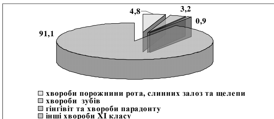
Рис. 3. Структура працевтрат офіцерів в результаті хвороб органів травлення (з урахуванням хвороб порожнини рота) по нозологічним формам за 2009 - 2013 роки

В структурі працевтрат офіцерів в результаті хвороб органів травлення (з урахуванням хвороб порожнини рота) по нозологічним формам за 2009 – 2013 рр. перше місце займали хвороби порожнини рота, слинних залоз та щелепи з показником 90,9 ‰ (4,8 ‰), друге – хвороби зубів – 63,3 ‰ (3,2 ‰), гінгівіт та хвороби парадонту посідали третє місце з показником 14,9 ‰ (0,9 ‰), інші хвороби – 1417,3 ‰ (91,1 ‰) (рис. 3).