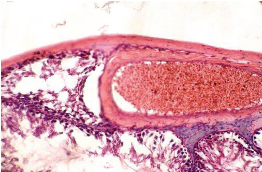
Рис.3. Понокров'я вени, деструктивні процеси у її стінці, десквамація сперматогенного епітелію у звивистих сім'яних трубочках. Забарвлення гематоксилін-еозином. Зб.: x 140.