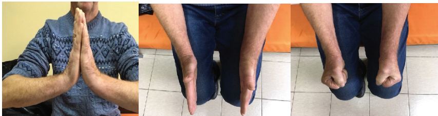
Рис. 4. Функція кінцівки через 60 днів після операції

При опитуванні усіх хворих за шкалою DASH функцію пошкодженої руки вони визначили як задовільну - 33,2+ 0,4 бала.