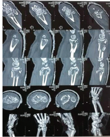
Рис.1. Рентгенографія, КТ з 3D реконструкцією перелому

індивідуальних особливостей по рентгенограмі здорового променевоzap'ястного суглоба), параметри долонного нахилу суглобової фасетки. Взяти трансплантат ідеальної потрібної форми з гребеня клубової кістки на практиці не є можливим, тому витримуються лише його основні параметри. Після установки кортикального блоку по тильному дефекту відламки зів'язувалися і фіксувалися. Здійснювався інтраопераційно контроль з використанням ЕОПа.