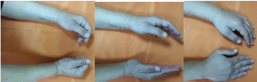
Рис.3. Функція кисті на 14 добу (зняті шви)

На 2 день після травми хворі починали ЛФК пальців по 1 періоду, проводилися фізіопроцедури: УВЧ і магнітотерапія.