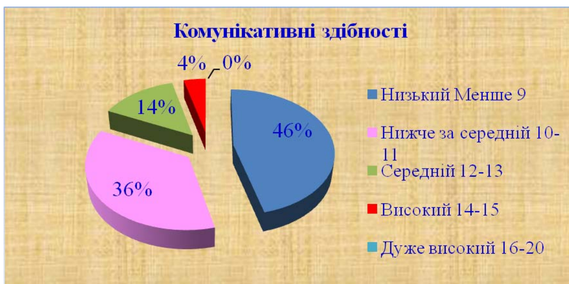
Рис.1. Результати діагностування за тестом «Комунікативні та організаційні здібності»

Загальні результати діагностування за тестом «Комунікативні та організаційні здібності» свідчать, що організаційні здібності в професійній молоді професійно-навчальних закладів України сформовані краще (63%), ніж комунікативні (37%). Якщо проаналізувати комунікативні здібності респондентів за рівневим принципом, враховуючи кількість набраних ними балів, що передбачено методикою діагностування, то маємо такий результат: 1. Низький рівень комунікативних здібностей (менше 9 балів) – 46%. 2. Нижчий за середній (10-11 балів) – 36%. 3. Середній рівень сформованості комунікативних здібностей (12-13 балів) – 14%. 4. Високий рівень вияву комунікативних умінь (14-15 балів) – 4%. 5. Дуже високий рівень вираження (16-20 балів) – 0%, що відображено на рисунку 1.