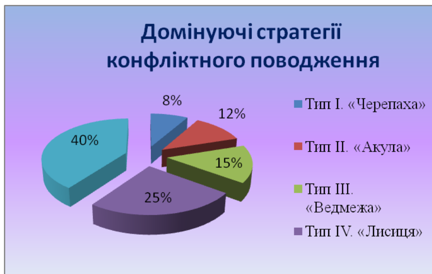
Рис. 2. Результати діагностування за тестом «Домінуючі стратегії конфліктного поведіння»

До тестування було залучено молодь різних професійно-технічних закладів України. Показники здійсненого опитування подано на рисунку 2.