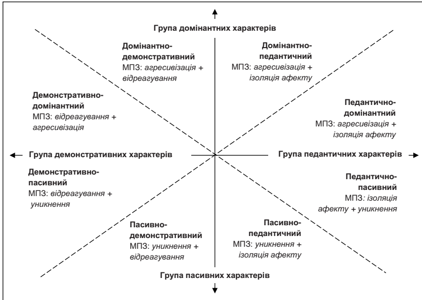
Рис. 2. Структурна онтологія характерологічного поля

«Стандартний список складається з 16 позицій, які представлено у вигляді бінарних змінюваних... Параметри, що увійшли у список, мають важливу властивість – вони є взаємозалежними та можуть бути присутніми у тексті в будь-якому наборі. Індивідуальна світоглядна картина людини може бути виокремлена з його текстів, формалізована та представлена у вигляді «карти», як унікальна комбінація текстових параметрів» (Новікова-Грунд, 2014: 89). Вказаний інструмент було застосовано як засіб формалізації і систематизації досліджуваного мовлення. В даному випадку ми не ставили за мету вивчити екзистенційний світоглядний зміст, натомість зосередились на перевірці гіпотези щодо наявності у представників різних типів характеру сталих відмінностей мовлення, які були б придатними для прикладних цілей контактної психодіагностики.