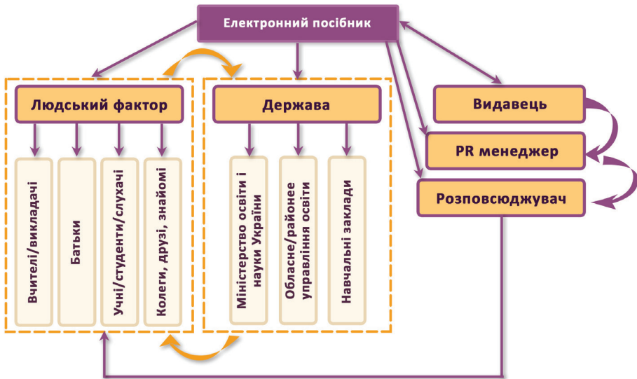
Рис. 2. Освітнє середовище електронного посібника

Конструювання електронного посібника сприяє формуванню середовища для людської діяльності (рис. 2). Будь-який посібник є елементом освітнього середовища,