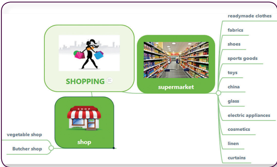
Рис. 5. Фрагмент інтелект-карти за темою «Shopping»

Так, в експерименті взяли участь 62 особи, яких було розподілено на три вікові категорії: 46–55 років; 56–65 років; від 66 років. У першій групі був 21 респондент, у другій — 20, у третій — 21. По-перше, перевірялась кількість вивчених слів, по-друге, співвіднесення малюнка та слова, по-третє, пропонувалось вставити пропущені слова у текст (перелік слів не надавався).