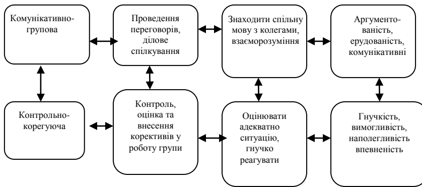
Рис. 2 Схеми складових професійної діяльності менеджера

Таким чином проаналізувавши дослідження вітчизняних та зарубіжних вчених щодо сутності конкурентоспроможності й спираючись на паспорт спеціальності економістів та менеджерів зроблено висновок, що конкурентоспроможність майбутніх економістів це узагальнене поняття, яке складається з чотирьох компонентів, а саме: індивідуально-мотивований, професійно-репродуктивний, рефлексивно-контролюючий та вдосконалюючо-дієвий, кожен з яких має свій зміст та функції.