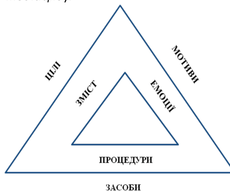
Рис. 2. Медіація в рамках професійної діяльності

Трансформуючи класичні елементи діяльності на медіацію можемо зробити таку порівняльну характеристику (Рис. 2. Медіація в рамках професійної діяльності, де зовнішній трикутник уявляє собою діяльність , а внутрішній – медіацію ):