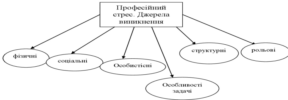
Рис. 2. Джерела виникнення професійного стресу

Зміна стресогенності робочого середовища вимагає розуміння взаємовідносин між індивідуальними і організаційними умовами. Суттєвим моментом при цьому стає розуміння індивідуально-типологічних особливостей самої людини з її цінностями, намірами, інтелектом, емоціями та потенціалом.