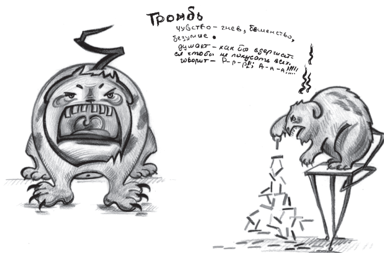
Рис.1 «Громбь» (январь 2012г.)

сти, рефлексии). Цель: обеспечить развитие профессионально важных качеств педагога. Выявить личные ресурсные компоненты. Научить техникам самопомощи, эффективно-го использования рабочего и свободного времени. Помочь обозначить перспективные направления профессионального и личностного развития каждого.