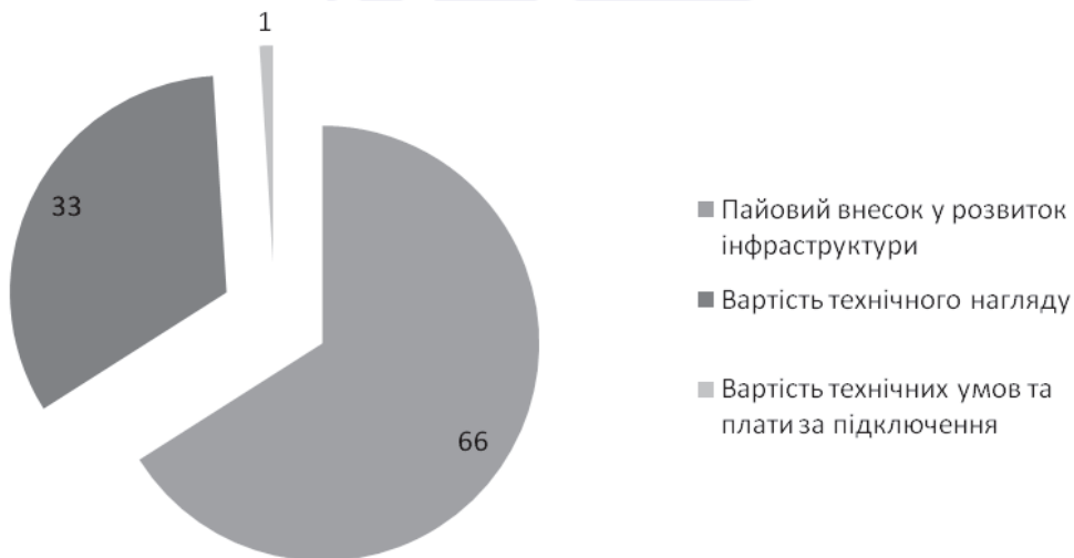
Рис. 3. Структура вартості процедур у будівництві, (%)

Таким чином скорочення вартісного показника процедур у будівництві є основним ресурсом можливого підвищення позиції України у рейтингу “DoingBusiness” за індикатором “Отримання дозволів у будівництві”. Доцільне зменшення розміру або відміна пайового внеску з одночасним визначенням альтернативних джерел фінансування витрат на розвиток інфраструктури населених пунктів, оскільки такий платіж