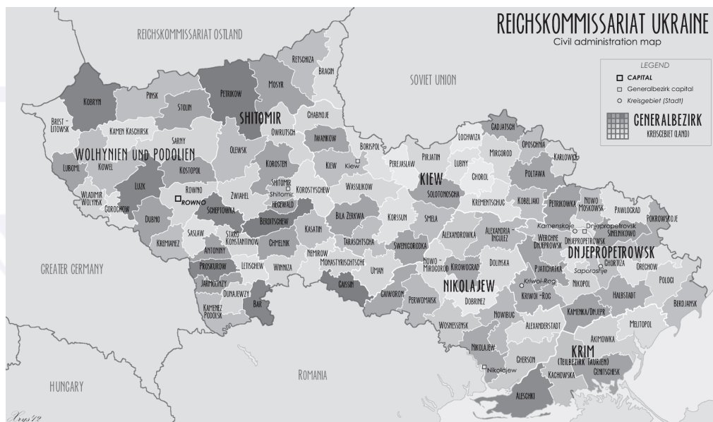
Рис. 1. Мапа Рейхскомісаріату “Україна”

комісарами, причому на перші дві посади призначав особисто фюрер, а керівників головних управлінь рейхскомісаріату, а також гебітскомісарів — рейхсміністр у справах окупованих східних областей.