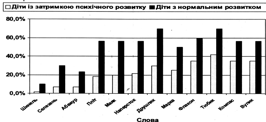
Рис. 2. Успішність вибору картинок дітьми із ЗПР та нормальним розвитком

Діти із затримкою психічного розвитку помітно відстають від дітей з нормальним розвитком за рівнем розвитку пасивного словника, що відображено на рис. 2.