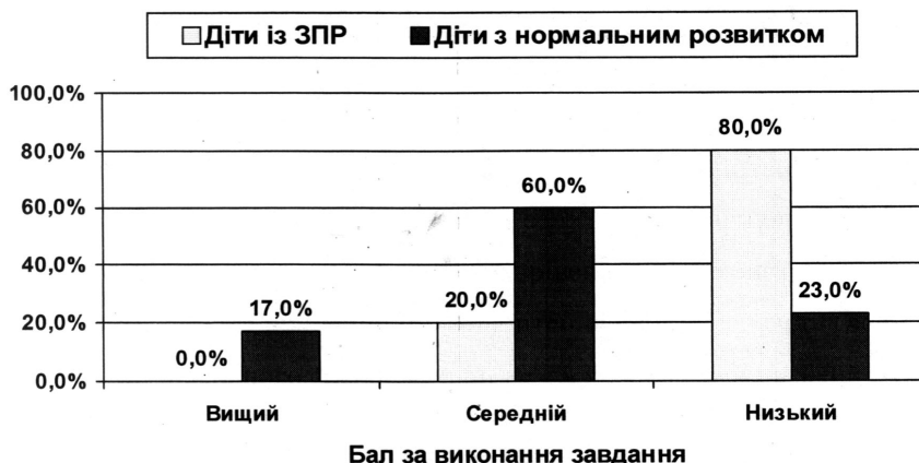
Рис. 3. Порівняння особливостей пасивного предметного словнику дітей з різними рівнями розвитку.

Дані, представлені в таблиці 3 та на рис. 3, показують, що найвищу оцінку не отримала жодна дитина із затримкою психічного розвитку, тоді як 3 дитини з нормальним розвитком набрали по 5 балів. Більшість дітей із ЗПР (80,0%) отримали мінімальну оцінку - 1 бал і лише 20,0% дітей діяли на рівні середнього і набрали по 2 бали. Натомість серед дітей старшого дошкільного віку з нормальним розвитком високий рівень продемонстрували 16,7% досліджуваних, більше половини (60,0%) дітей показали середній (достатній) рівень розвитку пасивного словнику, і лише 23,3% показали низький рівень.