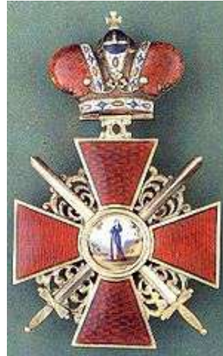
Рис. 2. Орден Св. Анни 2-ступеня [6].

Імператорський орден Св'ятої Анни був затверджений в 1735 році як династійна нагорода, а в 1797 році - був введений імператором Павлом I в нагородну систему Російської імперії для відзнаки державних чиновників та військових. На ордені Св'ятої Анни другого ступеня було зображено імператорську корону та мечі. В лютому 1874 року було відмінено знаки ордену з імператорською короною, капітульним храмом ордену стала церков Св'ятих Сіміона та Анни в Санкт-Петербурзі. З 1873 року настає новий період для розвитку Харківського вищого ветеринарно-освітнього закладу. Ветеринарне училище в місті Харкові реформується в інститут. Виконуючи політику та спрямування уряду про захист тваринництва від масової загибелі тварин та припиненні збитків для населення, було вирішено реорганізувати ветеринарне училище. З метою покращення внутрішньої організації, доповнення матеріальними засобами, розширення професорсько-викладацького складу та збільшення кількості слухачів [2].