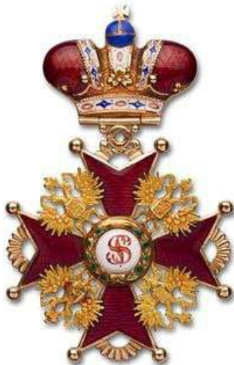
Рис.1. Орден Св. Станіслава 2 ступеня [5].