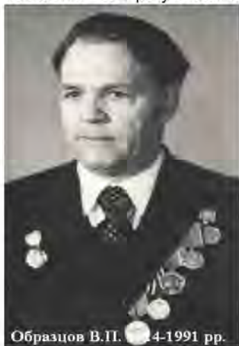
Образцов В.П. 4-1991 рр.

Видатний вчений та судово-ветеринарний експерт Образцов Василь Петрович народився 13 жовтня 1924 року в селі Велика-Яруга Ново-Оскольського району Белгородської області в сім'ї