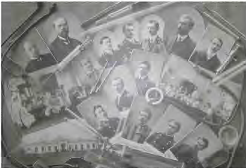
Рис. 3. Професор О. В. Дедюлін і студенти Харківського ветеринарного інституту (1914 р.).

В Празі О.В. Дедюліним, на прохання вченої корпорації вищої навчальної школи і студентів, прочитано 2 лекції. Відвідування Чехословаччини у 1924 році в якості директора Інституту наукової і практичної ветеринарії мало істотне суспільне і міжнародне значення. Воно знаменувало початок розвитку добросусідських відносин між нашими державами в галузі ветеринарної медицини. В 1975 році ця подія була відмічена створенням ювілейної медалі. На ній зображено портрет О.В. Дедюліна, його ім'я та прізвище російською і чеською мовами [2].