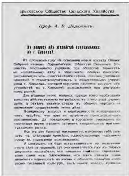
Рис. 1. Работа професора О.В. Дедюліна "К вопросу об устройстве холодильника в г. Харькове"

В 1912 році Олександр Васильович організував Холодильний комітет у Харкові і був обраний головою цього комітету. Завдяки активній діяльності видатного бактеріолога О.В. Дедюліна Харківський ветеринарний інститут став провідним в Росії з організації холодильної справи.