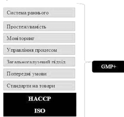
Рис. 2. Схема складових частин контролю безпеки кормів

Складовими частинами GMP+ є система простежуваності якості конкретної кормової продукції для тварин і птиці, а також система раннього сповіщення та реагування (EWS), основна мета якої - максимально швидке виявлення усяких порушень у кормах або компонентах, своєчасне реагування на інциденти і розповсюдження інформації серед учасників виробничо-збутового ланцюжка, з метою попередження або мінімізації шкідливих наслідків для людей, тварин та навколишнього середовища.