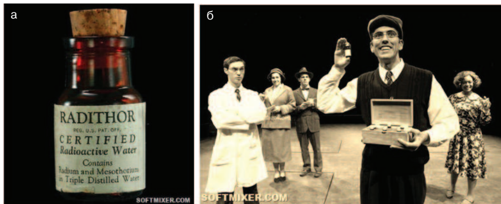
Рис. 1. Лекарственное средство «Radithor» (а) и его реклама (б)

Источники радиации не могли не заинтересовать просвещенных гомеопатов. Лекарственное средство «Radithor» (рис. 1) появилось в аптеках в 1918 году с припиской «радиоактивная вода» и содержало в