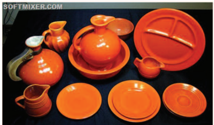
Рис. 6. Радиоактивные бокалы и посуда

Выпускалась и радиоактивная соль для ванн: "Применяется при нервных расстройствах, бессоннице, упадке сил, артрите и ревматизме. Растворите содержимое в емкости с горячей водой и вылейте в наполненную ванну. Оставайтесь в ванне 45 минут, после чего расслабьтесь в постели на один час" (рис. 7) - "лучшее в мире" средство от ревматизма, невралгии, люмбаго, растяжений, болей в спине, подагры, боли в конечностях, груди и горла.