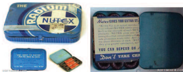
Рис. 11. Презервативы радиоактивные

Любопытно, что в XXI веке радиоактивные гаджеты по-прежнему производятся в Японии. Например, устройство под названием Well Aqua Bar (выпускается с 2005 года) представляет собой перфорированную металлическую палочку с торий-содержащим