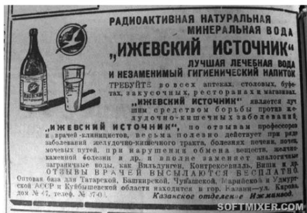
Рис. 2. Радиоактивная «натуральная» минеральная вода

Одним из популярнейших «гаджетов», свободно продававшихся с начала 1900-х по конец 1930-х, были специальные сосуды, которые позволяли «радиоактивировать» воду, добавляя туда радий. Подобные устройства активно рекламировались и носили говорящие названия вроде Radium Vitalizer Health Fount или Radium Spa.