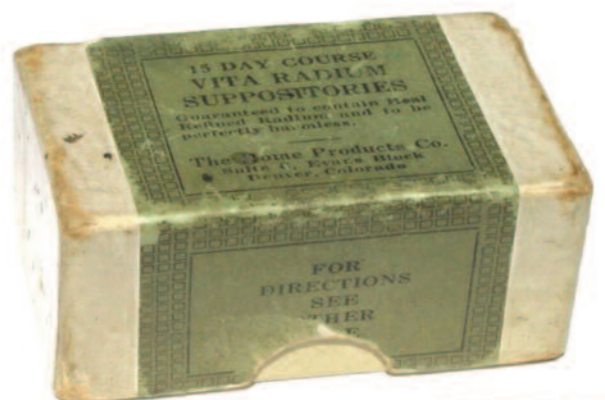
Рис. 8. Анальные свечи для лечения геморроя с содержанием радия