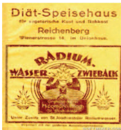
Рис. 13. Радиоактивный хлеб

керамическим стержнем внутри. При помещении в воду устройство ионизирует ее и обеззараживает — так утверждает производитель. Существует также аналогичный активатор воздуха (с виду — обычная автомобильная «пахучка») Well Aqua с торием, браслет с частичками тория (для улучшения самочувствия при беге) и керамические диски для активации воды Kometatsukun.