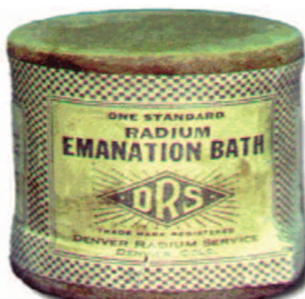
Рис. 7. Радиоактивная соль для ванн

Но еще удивительнее, что компания из Денвера предлагала покупателям радиоактивные таблетки для борьбы с «мужской слабостью»: "Принимайте радий в таблетках перед едой 3 раза в день" (рис. 9). Другая компания предлагала суппозитории с радиоактивным радием и маслом какао (рис. 10). Считалось, что его использование повышает тонус и прибавляет жизненных сил. Средство увеличения активности сперматозоидов с радием носилось в кармане поближе к сперматозоидам. У этого спер-