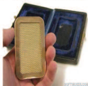
Рис. 10. Суппозитории с радиоактивным радием

матозоидного средства был довольно антуражный чехол.