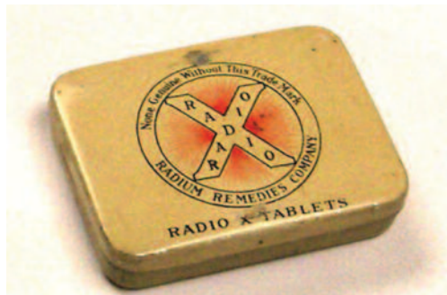
Рис. 9. Радиоактивные таблетки для борьбы с «мужской слабостью»