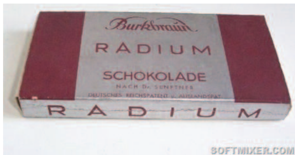
Рис. 12. Радиоактивный шоколад