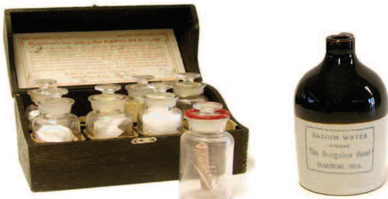
Рис. 5. Различные варианты получения радиоактивной воды