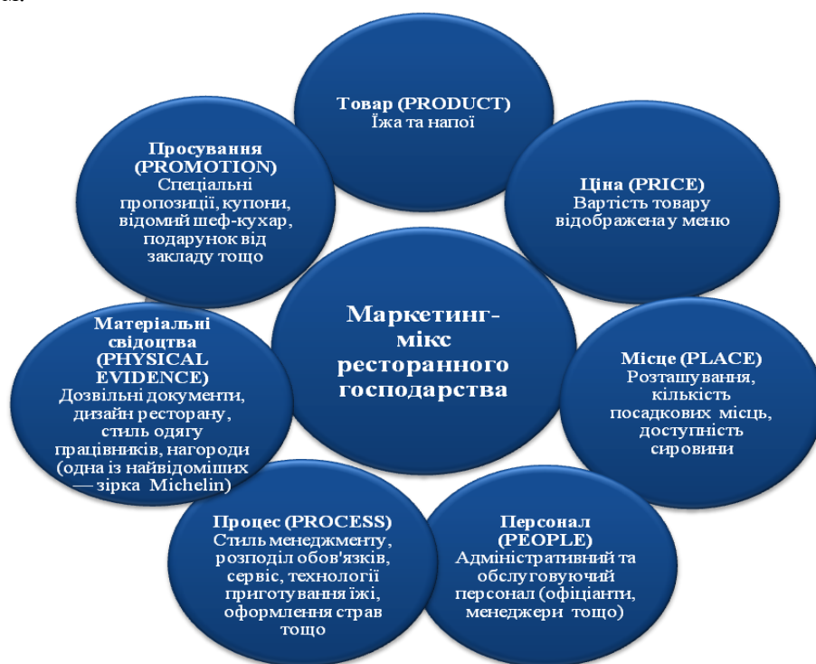
Рис. 1. Маркетинг-мікс ресторанного господарства

Першим елементом комплексу маркетингу ресторанного господарства є товар (product). Товар не обов'язково повинен мати усі атрибути, важливі для клієнта, але, володіючи хоч би однією унікальною властивістю, що становить цінність для цільової аудиторії, він неодмінно користуватиметься попитом.