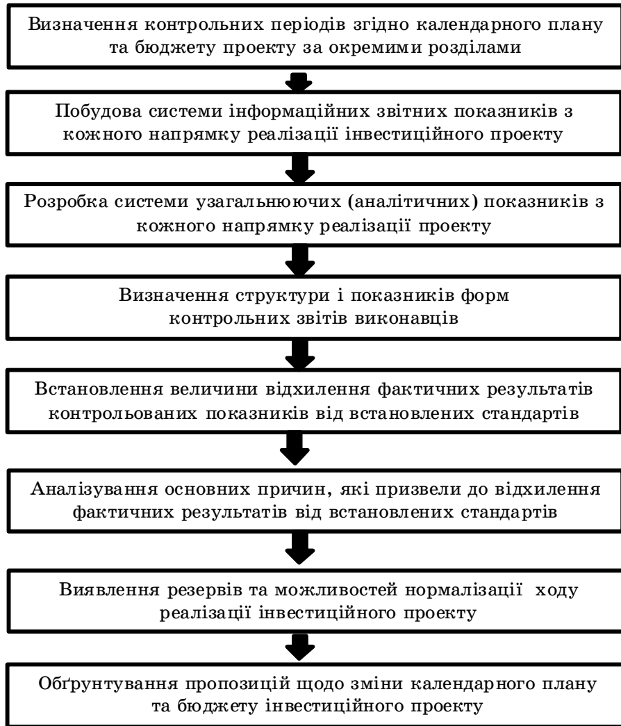
Рис. 2 Зміст та послідовність основних етапів побудови системи моніторингу інвестиційного проекту підприємства. [6, с. 252]