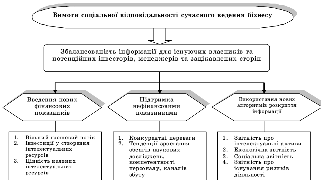
Рис.2. Стейкхолдерська концепція у розкритті інформації про фактичні та потенційні наслідки господарських операцій та подій

Необхідно підкреслити, що згідно традиційної фінансової теорії, якщо ліквідаційна вартість активів перевищує приведену оцінку майбутніх грошових надходжень від продовження бізнесу, то він має бути ліквідованим. Проте співставлення ліквідаційної вартості активів з потоками вигід від такої діяльності не враховує втрату нематеріальних активів. Адже ті специфічні знання, навички, командний досвід спільної праці, які були отримані раніше, будуть назавжди втрачені і для власників, і для персоналу.