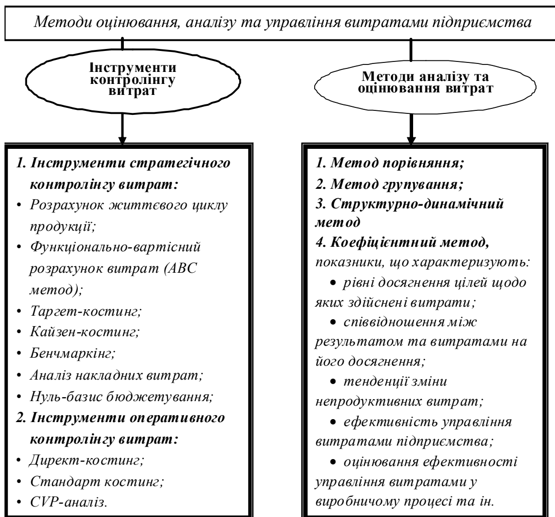
Рис. 2. Методи оцінювання, аналізу та управління витратами підприємства