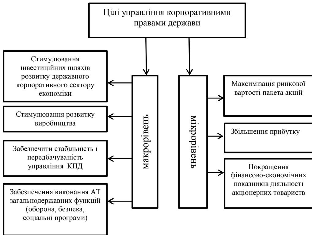
Рис.1. Цілі управління корпоративними правами держави

З даних табл.1 видно, що корпоративний портфель держави має стійку тенденцію до зменшення: загальна кількість господарських товариств за