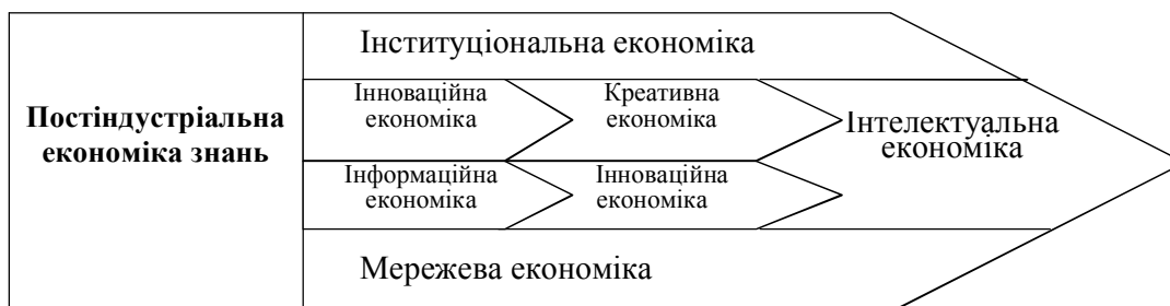
Рис. 4. Еволюція економічних систем у постіндустріальній знаннєвій парадигмі

При цьому важливо зазначити, що знання та інформація як стратегічний ресурс розвитку, не маючи ознак вичерпності через детермінованості лише специфічними якостями людини стосовно здатностей до інтелектуальної активності, одночасно є комерційними активами, акумуляція