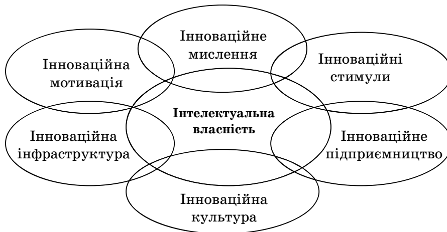
Рис. 2. Інтелектуальна власність в інституційному середовищі інноваційної економіки

ту між творцями, посередниками, кінцевими споживачами; активізує системні науково-технічні дослідження, міжсуб'єктну та міжгалузеву дифузю інновацій, кооперацію між суб'єктами інноваційного процесу через трансфер технологій, інтегрує ресурси для проведення спільних досліджень, сприяє розвитку новітніх форм патентно-ліцензійної кооперації фірм, залучення споживачів до інноваційного процесу; розширює межі національних інноваційних систем на основі відображення новітніх науково-технічних досягнень у процесі реєстрації та охорони доменних імен у мережі Інтернет, функціонування електронних систем подання та обробки патентних заявок, формування сучасних елементів інфраструктури,