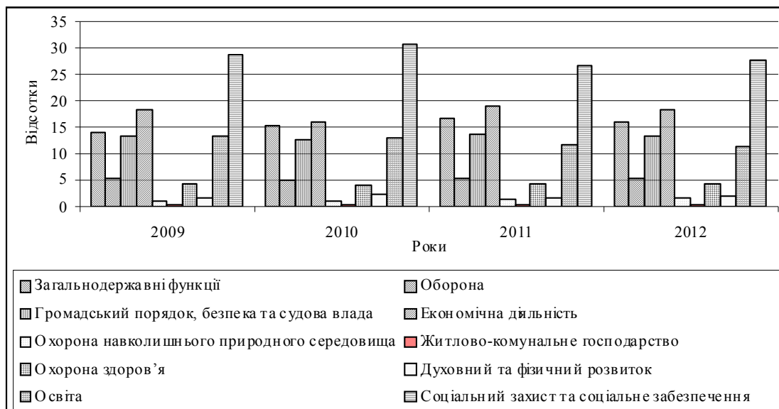
Рис. 1. Структура бюджетних видатків України протягом 2009-2012 рр.

(13,4%) та на освіту - 30243,2 млн. грн. (11,2%). Другу п'ятірку формують видатки на оборону - 14485,7 млн. грн. (5,3%), охорону здоров'я - 11358,5 млн. грн. (4,2%), духовний та фізичний розвиток - 5488,5 млн. грн. (2,0%), охорону навколишнього середовища - 4135,4 млн. грн. (1,5%) та на житлово-комунальне господарство - 379,7 млн. грн. (0,1%), (рис. 1).