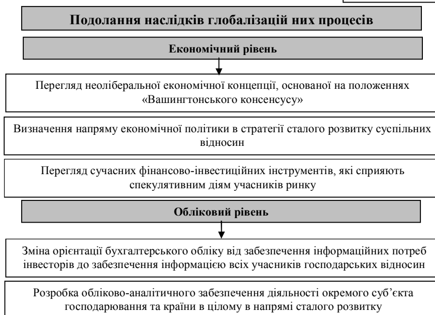
Рис. 2 - Місце глобалізаційних процесів в розвитку світового господарства та національних економік