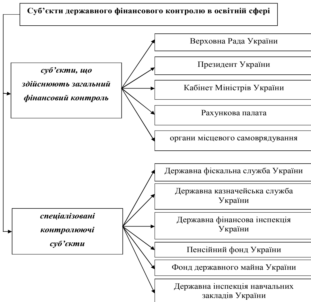
Рис. 2. Суб'єкти державного фінансового контролю в освітній сфері України*

Визначальне місце серед елементів державного фінансового контролю за формуванням та використанням коштів освітніх закладів посідають суб'єкти контролю, які є найактивнішими складовими системи фінансового контролю в цілому і утворюють єдину організаційну систему. Зараз в Україні функціонує значна кількість державних органів і служб, які тією чи іншою мірою здійснюють фінансовий контроль за використанням коштів навчальними закладами. З рис. 2 видно, що всіх їх можна поділити на дві великі групи. Так, суб'єкти, що здійснюють загальний фінансовий контроль, поряд з виконанням інших функцій наділені контрольними повноваженнями. Для цих суб'єктів контрольна функція у фінансовій сфері є другорядною;