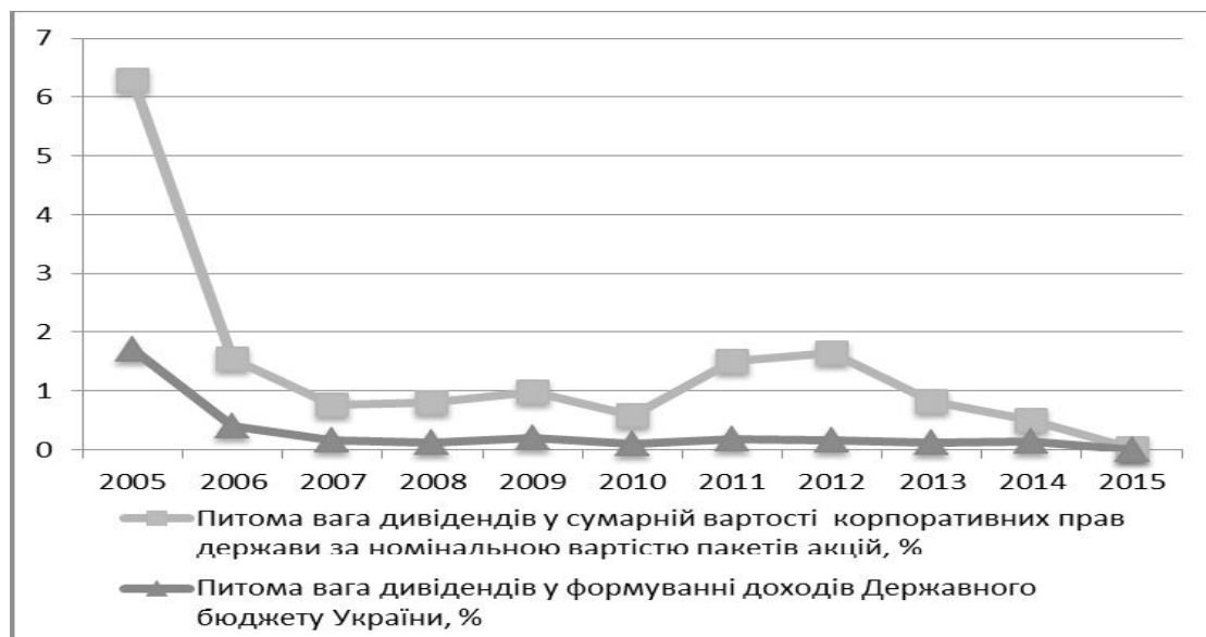
Рис.2. Питома вага дивідендів у сумарній вартості корпоративних прав держави за номінальною вартістю пакетів акцій та у формуванні доходів Державного бюджету України, %