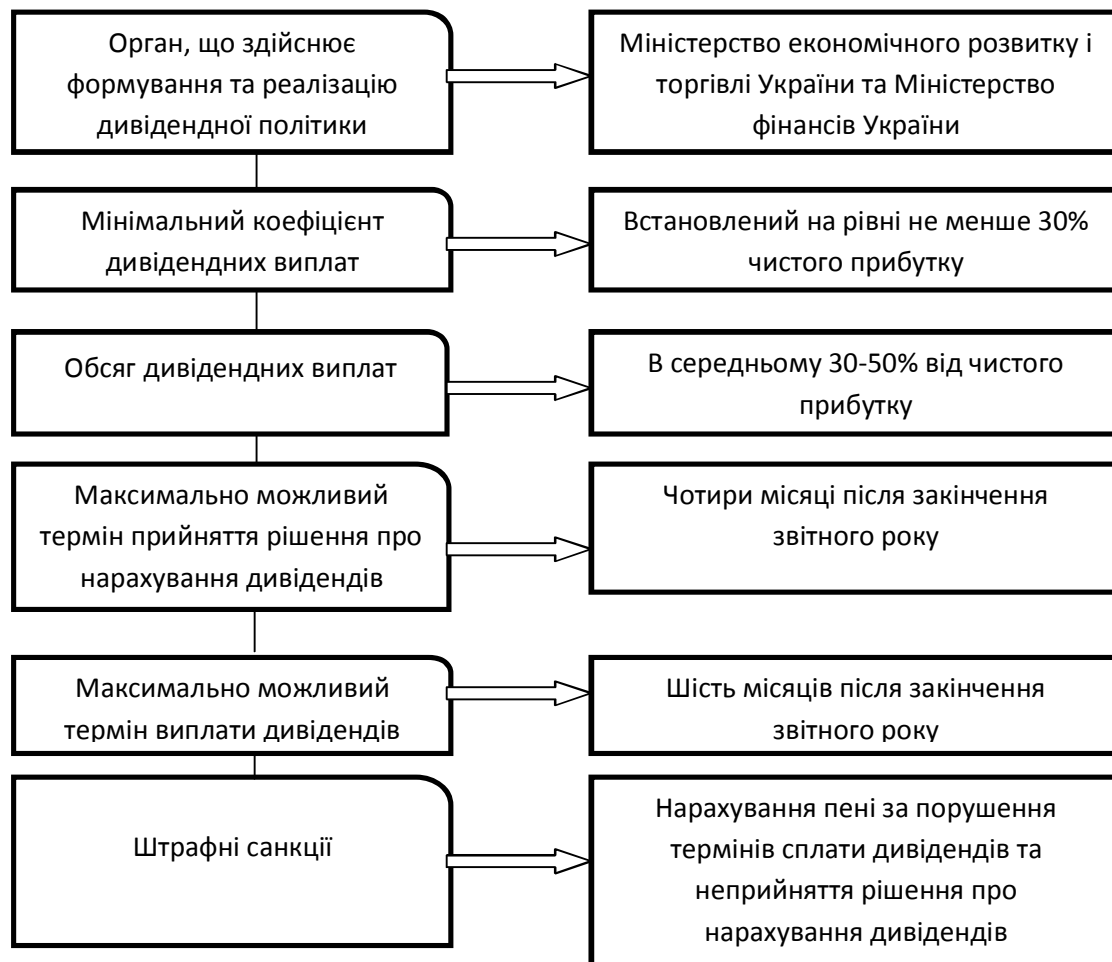
Рис.1. Характеристика основних параметрів дивідендної політики підприємств державного сектору економіки