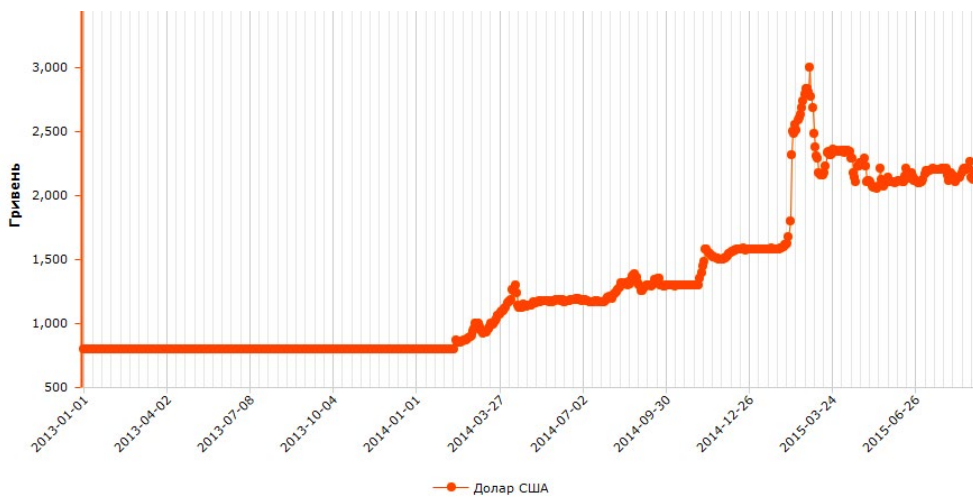
Рис.2. Динаміка зміни офіційного курсу гривні до долара США 01.01.2013-01.09.2015 р.