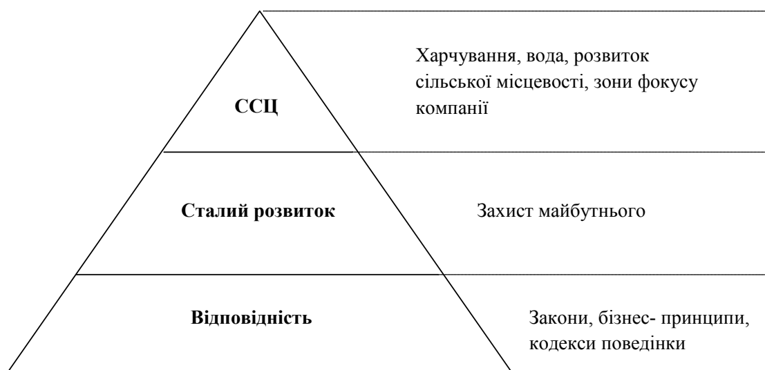
Рис. 2 Піраміда створення спільної цінності (ССЦ) Nestlé

Матриця суттєвості 2014 дозволяє говорити про підвищену увагу як акціонерів, так і керівництва компанії до таких викликів як надлишкове та недостатнє харчування і контроль за використанням води. Вона також демонструє стурбованість акціонерів зміною клімату та увагу до природного капіталу та прав людини. Керівництво компанії ж поряд з цими питаннями фокусує свою увагу на проблемі харчових відходів та захисті тварин. Відповідальні практики компанії співвідносяться з найсуттєвішими викликами в матриці. В таблиці 2 представлені основні зобов'язання Nestlé з створення спільних цінностей, виконання яких може бути продемонстровано численними соціальними ініціативами в різних країнах світу, в тому числі в Україні. Реалізація стратегії створення спільних цінностей Nestlé на вітчизняному ринку може бути репрезентована такими проектами компанії як «Абетка харчування» (навчальний курс для учнів 1-4 класів, який став складовою курсу «Основи здоров'я» для середніх шкіл); «Господар» (програма розвитку вітчизняних постачальників з метою досягнення ними того рівня розвитку виробництва, який міг би забезпечити відповідність сировини та умов її виготовлення стандар-