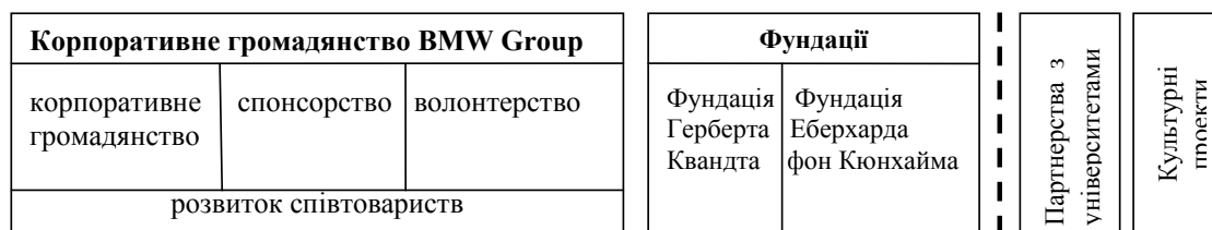
Рис. 1 Модель «корпоративного громадянства» компанії BMW