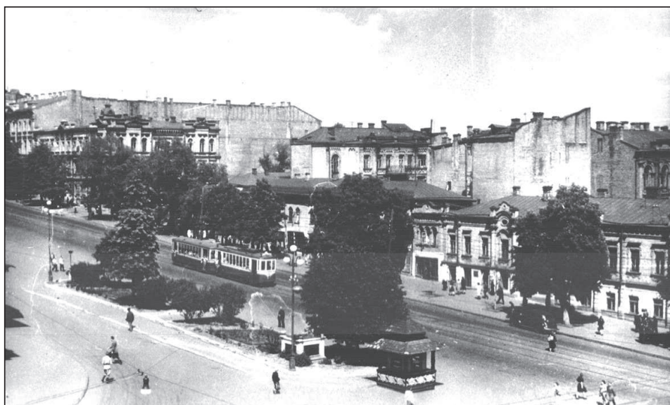
Рисунок 3. Забудова вул. Володимирської проти Оперного театру. Світлина 1938 р.