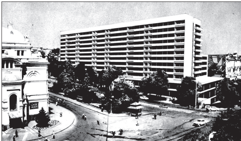
Рисунок 4. Проект. Варіант фасаду. Фотомонтаж. 1963 р.

Крім документальних і графічних матеріалів в архівній справі за 1963-64 рр. є цікава фотографія – монтаж з варіантом головного фасаду (рисунки 4).