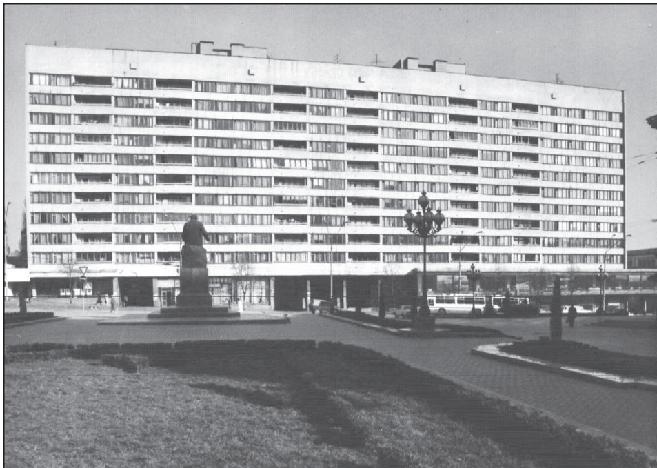
Рисунок 7. Головний фасад. Світлина. 1990 р.

На замовлення Головного управління житлового господарства виконавчого органу Київради у 2006 р. в інституті «НДІпроектреконструкція» почалась розробка проекту капітального ремонту будинку та нового опорядження фасадів.