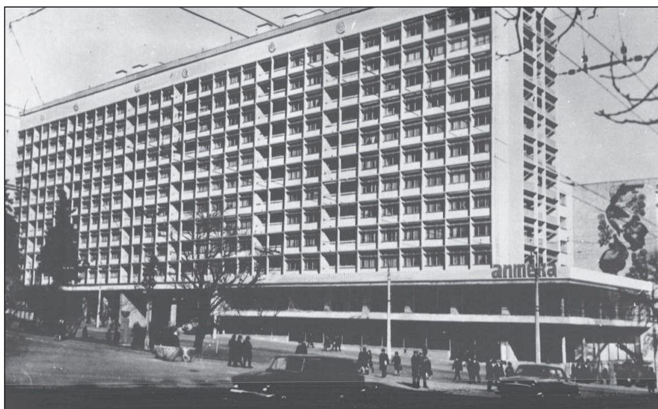
Рисунок 6. Проект реконструкції фасадів. 1984 р. Не здійснено.

У зв'язку з реконструкцією Оперного театру і необхідністю ансамблевого вирішення усїєї площі, у 1984 р. в інституті «Київпроект» був розроблений проект реконструкції будинку по вул. Володимирській, 51/55. Автор проекту – арх. В.Гопкало в пояснювальній записці виклав основні завдання реконструкції: обличкування листовим алюмінієм, установка декоративних ребер з алюмінієвого сплаву, покриття синьою глазурованою керамічною плиткою на 1-му поверсі тощо[25]. В архівній справі є фотомонтаж будинку з проєктованими змінами (рисунок 6).