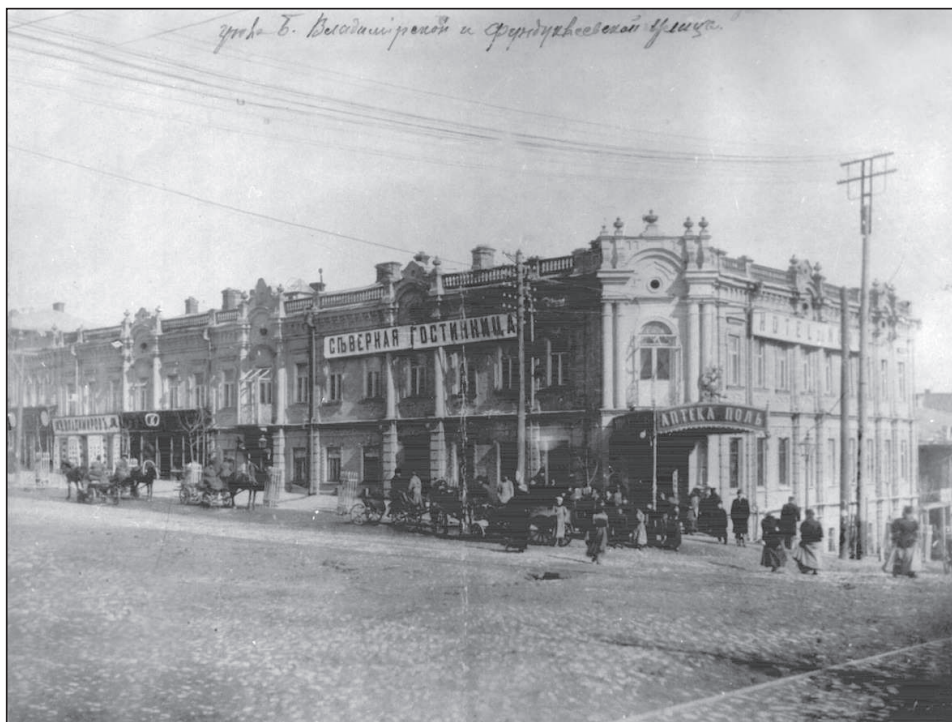
Рисунок 2. Перетин вул. Володимирської і Б.Хмельницького. Світлина к.19-поч. 20 ст.