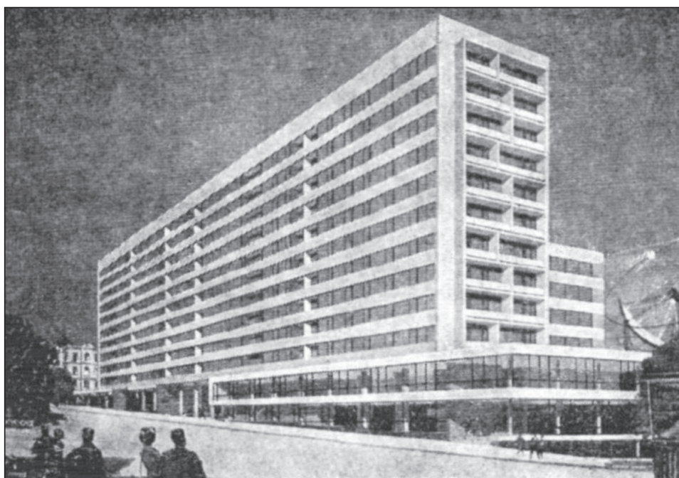
Рисунок 5. Проект будинку. Варіант фасаду. 1968