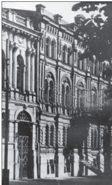
Рисунок 6. Терещенківська, 17. Світлина 1930-х рр.

У власності родини Сахновських садиба знаходилася ще на початку визвольних змагань в Україні: у відомостях фінансового відділу Київської міської управи за березень 1918 р. наводиться перелік житлових приміщень у садибі. У цей час родина домовласниці Є.Н.Сахновської займає 4 квартири в 1, 3, 4 поверхах і в мезоніні – всього 14 кімнат, 2 передпокою, 2 кухні, 5 кімнат для обслуги. У документі вказуються й інші мешканці в будинку, а також кількість займаних ними житлових і службових приміщень. Усього вказано на існування 8-ми квартир, з них дві – на 1-му та 2-му поверхах житлового флігеля [20].