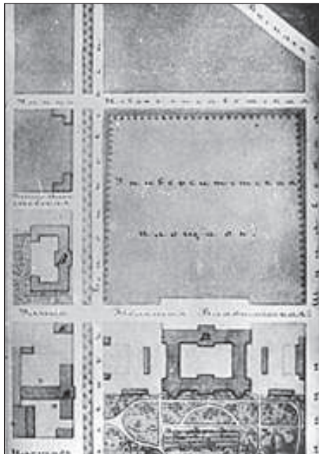
Рисунок 1. План Києва 1871 р. Фрагмент

Застройкою этого места, уничтожается один из значительных притонов преступлений и разврата и увеличится в городе пространство, способное к сооружению жилых зданий. Это обстоятельство имеет особенную важность частью потому, что в настоящее время ощущается недостаток в квартирах, частью потому, что в непосредственной близости площади и без того уже находятся незастроенные места, кои к постройкам не могут быть употреблены: таковы: Ботанический сад и рвы за ним и сад Гимназический. С застройкою пустопорожнего места пред Университетом уничтожается пространство совершенно разобщающее Университетские кварталы с центром города и напротив, в самом центре возникает два лучших квартала, в непосредственной близости учебных заведений. Существующее незастроенное место заключает в себе более 20 тыс. кв. саж. и от продажи его по участкам город мог бы приобрести огромную сумму» [2].