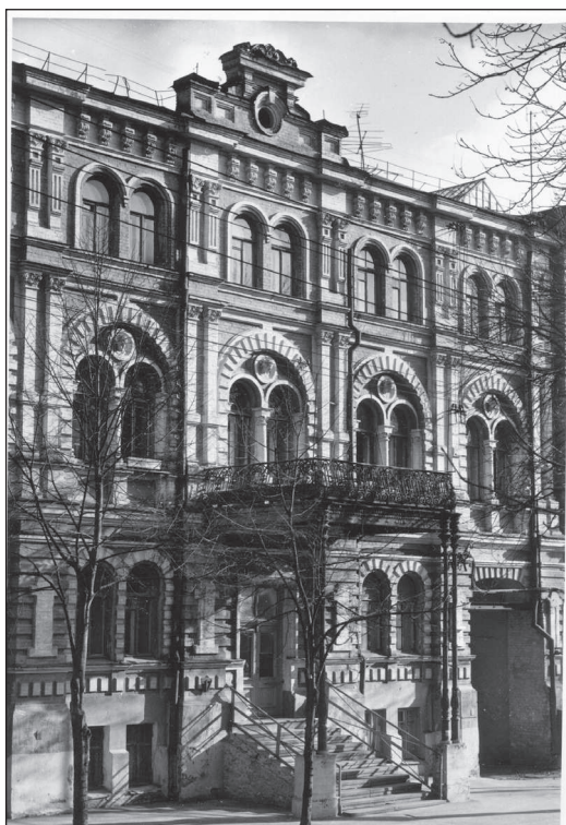
Рисунок 7. Терещенківська,17. Світлина 2002 р.

Будинок (рисунок 7) відрізняється високою культурою архітектурних деталей, що відповідають характеру, пропорціям і образу будинку в цілому, а його образно-стильова система органічно вписується в ансамбль фронтальної забудови вул.Терещенківської і відкритого простору Шевченківського парку.