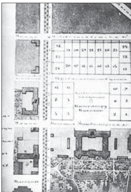
Рисунок 2. Проект пробивки сучасної вул.Терещенківської. 1872 р.

Утворений новий квартал проти університету у межах теперішніх вулиць Терещенківської, Пушкінської, Толстого та бул.Т.Шевченка був розпланований на ділянки (рисунок 2), що їх почали продавати з 1872 р.