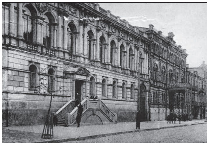
Рисунок 5. Терещенківська, 15, 17. Світлина 1920-х рр.

Пропорції будинку №17 трохи змінилися після нівелювання, зробленої у 1914 р. – рівень вул.Терещенківської на цьому відрізку понизився і під будинком з боку вулиці відкрився високий цокольний поверх. На фотографіях 20-30-х років ХХ в. видно, що спочатку цокольний поверх був глухим (рисунок 5), потім прорубані прямокутні віконні прорізи (рисунок 6).