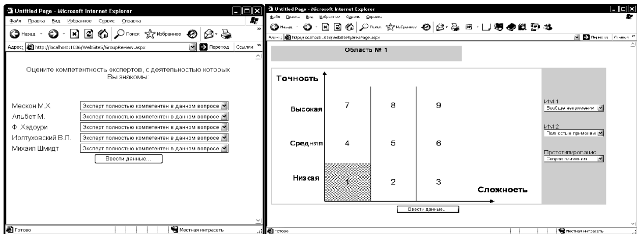
Рис. 3. Фрагменти інтерфесу користувача технології оцінювання адекватності.

Процес анкетування та розрахунку різних типів оцінок виконується за допомогою спеціалізованого Web - додатка. Адміністратор додатка згідні з входними даними підготовлює список експертів, вид та кількість анкет. Кожний з експертів проходить авторизацію, одержує доступ до анкет, відповідає на питання. Після того, як всі експерти пройшли опитування, проводиться розрахунок узагальнених оцінок. Фрагменти інтерфесу коистувача реалізованої технології наведено на рис. 3.