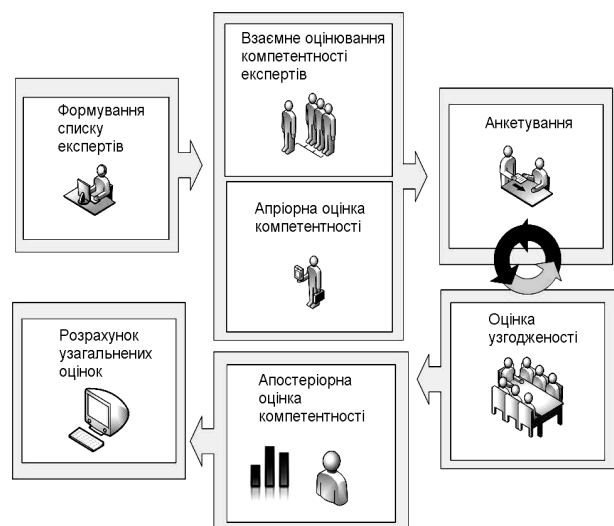
Рис. 2. Загальна схема експертної процедури оцінки ефективності ТЗЯ

Дуже важливу роль для точності результатів оцінювання має склад експертної групи. Коефіцієнт компетентності експерта визначається апріорними даними: аналіз фактичних даних про експерта, його самооцінка, взаємна оцінка інших експертів, й апостеріорними даними. За результатами експертизи оцінюється погодженість думок експертів, меншому відхиленню від середнього відповідає більша компетентність. Загальна схема експертної процедури представлена на рис. 2.