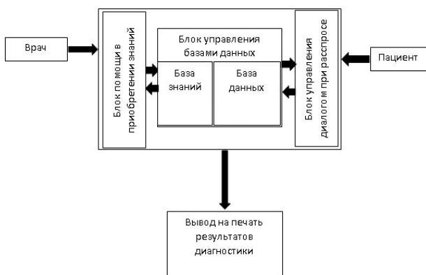
Рис. 2. Структура информационной системы скрининга

Для реализации модели данной информационной системы очень эффективно использовать аппарат нечеткой логики. Особенностью медицинских данных является сложность их обработки, связанной с разным характером их представления. На рисунке 2 представлена модель информационной системы для скрининга хронических печеночных заболеваний при помощи нечеткой логики, реализация которой возможна в соответствующих программах.