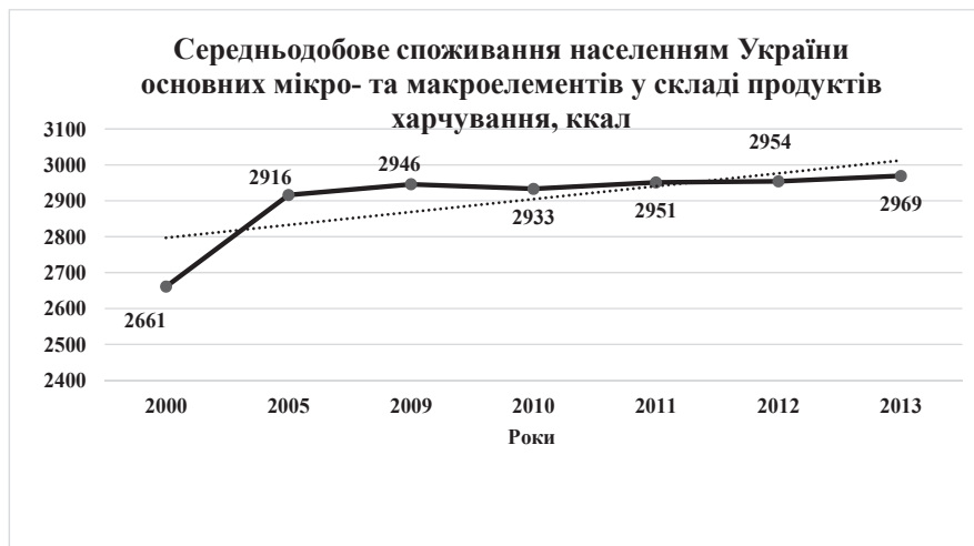
Рис.2 Середньодобове споживання населенням України основних мікро- та макроелементів у складі продуктів харчування за 2000 – 2013 рр., ккал

Простежити динаміку споживання калорій населенням України з 2000 по 2013 рр. ми можемо на рисунку 2.