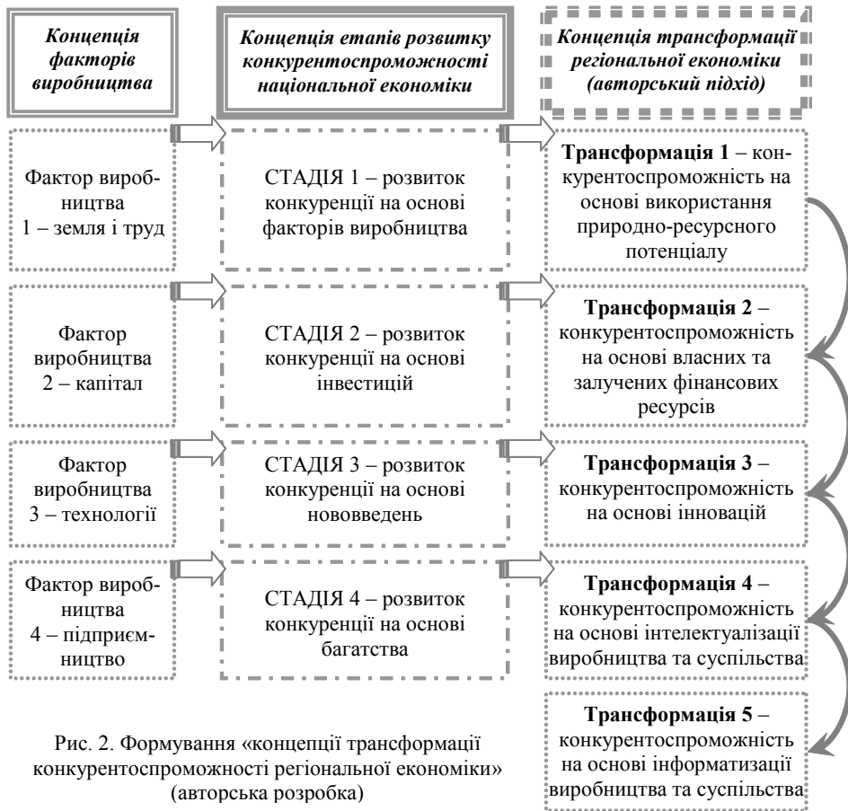
Рис. 2. Формування «концепції трансформації конкурентоспроможності регіональної економіки» (авторська розробка)

Такий найпростіший тип конкурентоспроможності – конкурентоспроможність на основі використання природно-ресурсного потенціалу – характерний, насамперед, для регіонів сільськогосподарської орієнтації, які охоплюють ті частини території країни, де спостерігаємо сприятливі для цього природно-кліматичні умови та багаті на урожай земельні угіддя.