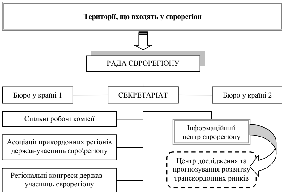
Рис. 3. Розташування транскордонного центру у складі євро регіону (Розробка автора)

розташування центру як організаційної структури запропоновано здійснити в рамках євро регіону у складі його інформаційного центру, передбаченого структурою самого євро регіону (рис. 3).