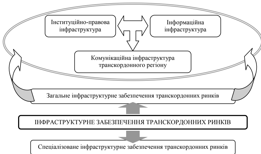
Рис. 1. Система інфраструктурного забезпечення транскордонних ринків (Розробка автора)

транскордонних ринків з позицій її взаємодії з суб'єктами господарювання в процесі транскордонного обміну дозволяє розглядати різноманітні аспекти її формування та вдосконалення.