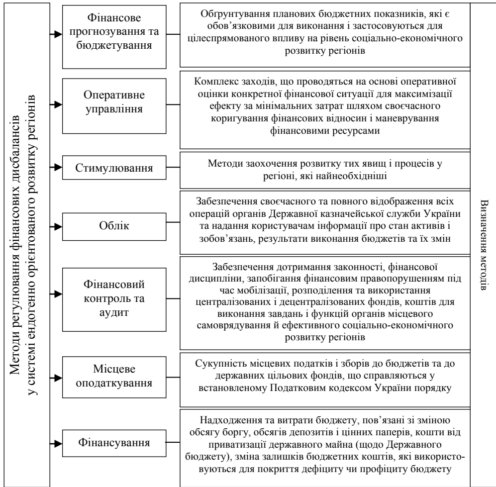
Рис. 3. Методи регулювання фінансових дисбалансів у системі ендогенно орієнтованого розвитку регіонів