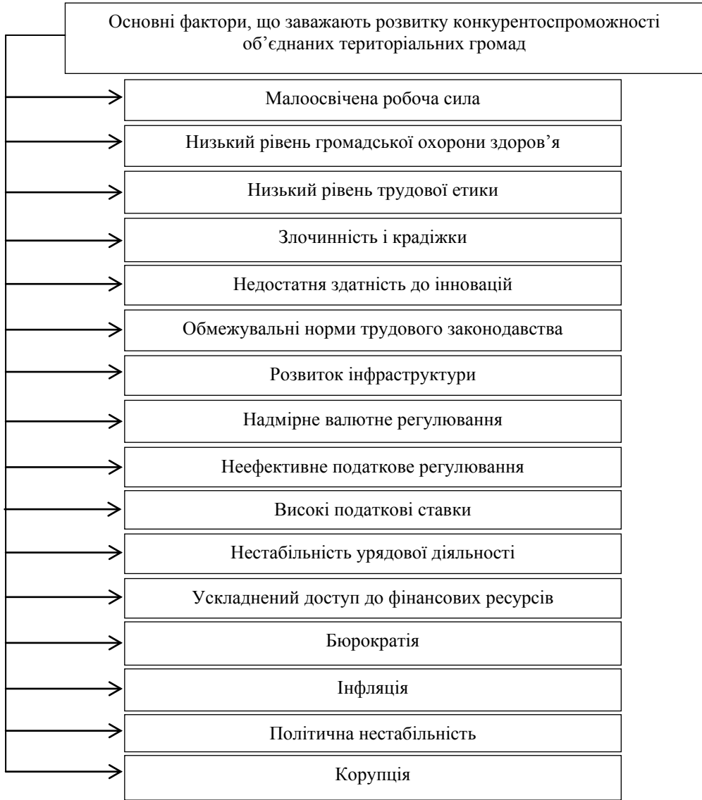
Рис. 3. Основні фактори, що заважають розвитку конкурентоспроможності об'єднаних територіальних громад