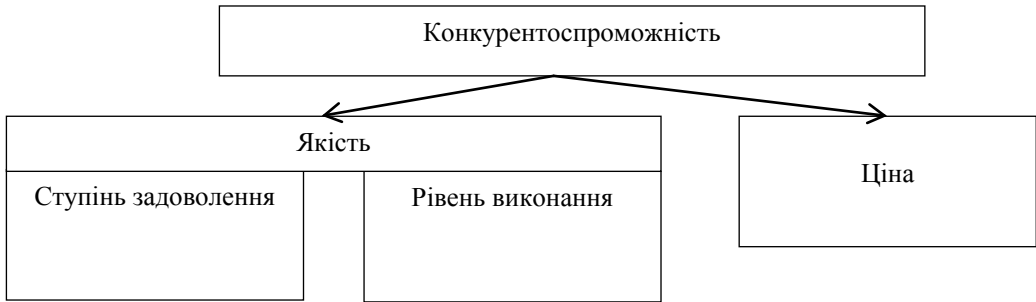
Рис. 1. Взаємозв'язок понять «якість» і «конкурентоспроможність» Складено на основі [8].

є виробниками товарної продукції. Однак саме вони найбільш наближені до реальних виробників, податки яких складають основу місцевих бюджетів.