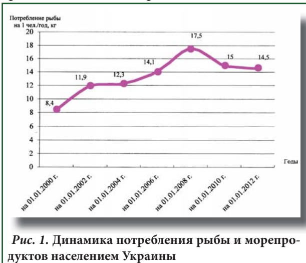
Рис. 1. Динамика потребления рыбы и морепродуктов населением Украины

По международным медицинским нормам годовое потребление рыбы и морепродуктов должно составлять 20 кг на человека. В то же время в Украине согласно данным Государственного комитета статистики на 01.01.2012 г. на одного человека приходилось всего 14,5 кг рыбы и морепродуктов [2]. В свою очередь, за последнее десятилетие наблюдается повышение уровня потребления гидробионтов (рис. 1), а в приморских регионах, столице и крупных промышленных городах Украины эта цифра, практически, приблизилась к норме. Так, в Крыму и Одесской области она составляет 18 — 19 кг, в Донецкой — 17,5 кг, в Киеве — 17 кг. В западных регионах ситуация обратная, здесь показатель потребления не дотягивает и до половины среднегодового по стране [3].