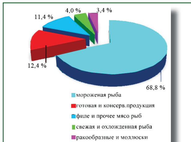
Рис. 4. Структура импорта рыбы и морепродуктов Украиной на 01.01. 2012 г.

В структуре импорта (рис. 4) 68,8 % занимает мороженая рыба, 12,4 % готовая и консервированная рыбная продукция, 11,4 % - филе рыбное и прочее мясо рыб, 4 % - свежая и охлажденная рыба, 3,4 % - ракообразные и моллюски.