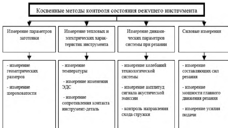
Рисунок 2 – Косвенные методы контроля состояния режущего инструмента

Наиболее «эластичным» направлением в контроле режущих инструментов является мониторинг (непрерывный контроль) непосредственно в процессе обработки. Все методы диагностики текущей работоспособности режущих инструментов можно условно разделить на четыре группы [13], а их, в свою очередь, на методы прямого контроля, основанные на непосредственной регистрации величины износа инструмента, и косвенного контроля (рисунок 2), использующие физические явления, которые сопровождают процессы резания и изнашивания инструмента [12].