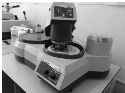
Рисунок 1 – Установа для отримання металографічних шліфів

У процесі досліджень застосовувався запропонований нами новий ефективний, але простий метод поперечного стиску оброблюваного матеріалу [9], що забезпечувало необхідну кількість цього матеріалу для експериментів. Величина попередньої холодної деформації регулювалась у широких діапазонах. Для цього було достатньо гідравлічного пресу зусиллям 200 тс.