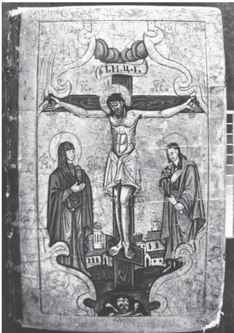
Іл. 1. Оправа (XVII ст.) з сюжетним зображенням «Розп'яття з предстоячими» Євангелія-тетр початку XVII ст. Матеріали: дерево, шкіра, паволока, левкас, темпера, олія, оліфа. Львів, НМЛ: Ркк-205.