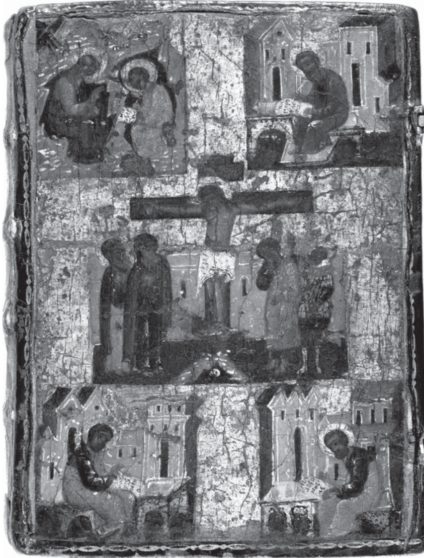
Лл. 3. Оправа (XVI ст.) з сюжетним зображенням «Розп'яття з предстоячими» Євангелія-тетр середини XVI ст.

Матеріали: дерево, шкіра, паволока, левкас, темпера, оліфа. Москва, ДІМ: Муз. 4133.