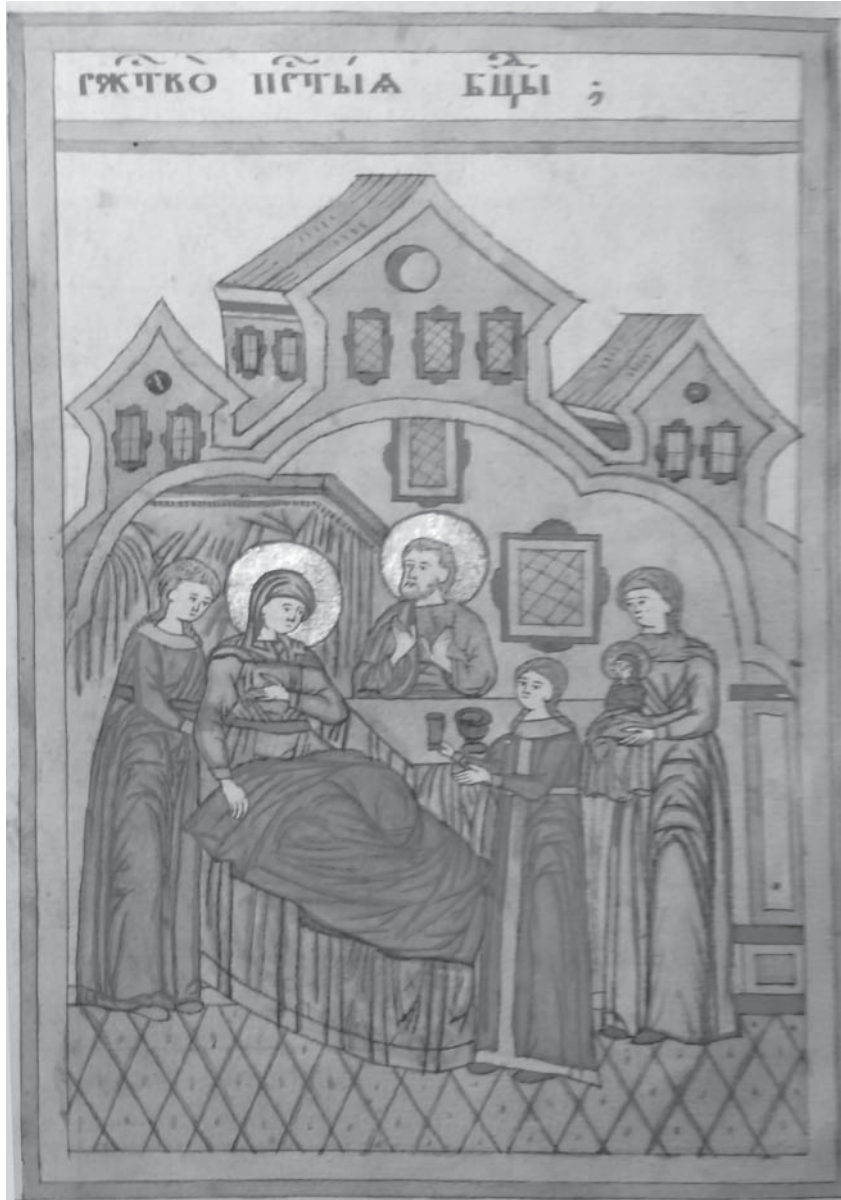
Мініатюра «Різдво Богородиці» (НМЛ: Ркк-69, арк. 1 зв.)