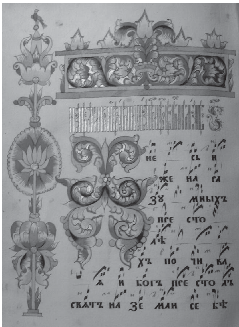
Заставка в прямокутній рамці з ініціалом «Д» та оздобленням на бічному полі (НМЛ: Ркк-69, арк. 3 зв.)