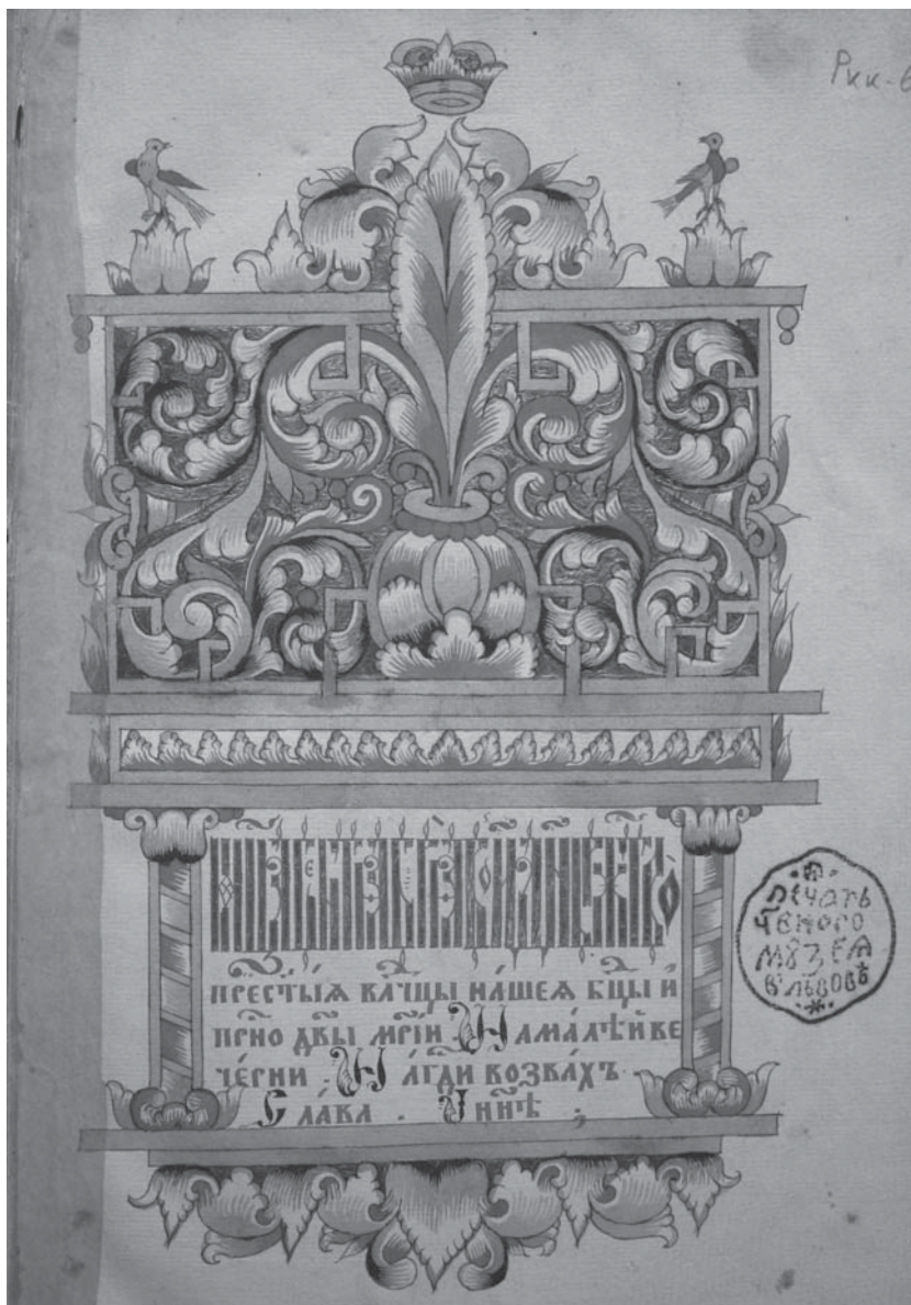
Заставка-рамка (НМЛ: Ркк-69, арк. 1)