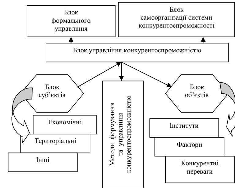
Рис. 2. Системний підхід до управління конкурентоспроможністю на принципі телеології [7]

4. Наступним важелем досягнення певної системної мети конкурентоспроможності на засадах телеології є соціальна політика та управління трудовим потенціалом. Інноваційно-інформаційна економіка, яка є майбутнім української господарської системи, визначає необхідність посилення уваги до вирішення питань праці в широкому сенсі. Саме інтелектуальна праця є основою побудови радикальних конкурентних переваг. Мотивований персонал, який складає трудовий потенціал конкурентоспроможності, забезпечує реалізацію поставлених цілей та, в свою чергу, є метою функціонування економічної системи. Забезпечення високих життєвих стандартів вже стало необхідною умовою високого рівня продуктивності праці на заході, спостерігається підвищення якості життя в Китаї, а підвищення продуктивності праці одночасно виступає умовою зростання доходів населення. Саме через призму трудових ресурсів та вирішення соціальних питань найбільш гостро проявляється телеологічний імператив формування конкурентоспроможності.