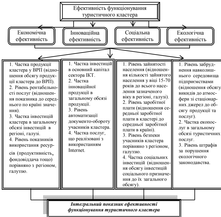
Рис. 3. Оцінка ефективності функціонування кластера за складовими

I_{\text{зв}} – зведені індекси складових ефективності (економічної, інноваційної, соціальної та екологічної).