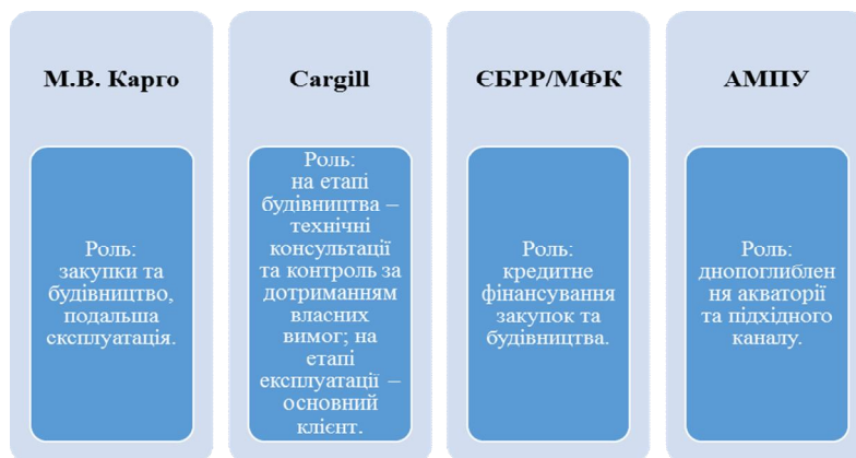
Рис. 2. Групи учасників проекту зернового терміналу «М.В. Карго»

– розвиток портової інфраструктури за рахунок впровадження передових міжнародних технологій перевантаження зерна та ін.